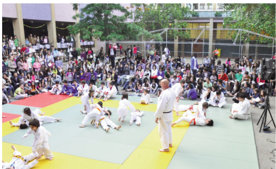
Demonstração de Judo, um momento alto

Colégio de São Teotónio: o humanismo cristão, um projeto educativo, uma escola plural