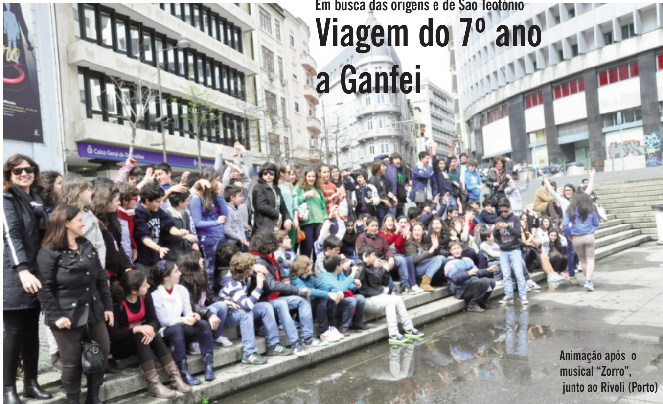
Animação após o musical "Zorro", junto ao Rivoli (Porto)

Nos dias quatro e cinco de abril, os alunos dos sétimos anos realizaram uma visita de estudo inserida no Roteiro de Escola, a Ganfei, terra Natal de São Teotónio. Entusiasmados com a ideia de dois dias diferentes da sua rotina habitual, era evidente a alegria e boa disposição que reinava no grupo.