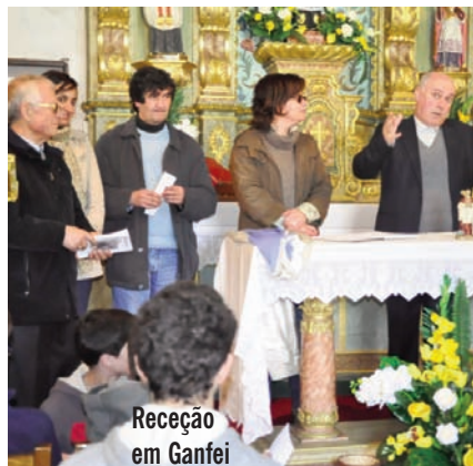
Receção em Ganfei

Já no segundo dia e depois de uma noite na fantástica Casa da Torre, em Braga, chegámos ao Aquamuseu de Vila Nova de Cerveira, local que pretende promover e divulgar o património natural do Rio Minho, sugerindo estratégias para o seu usufruto e respetiva preservação. De seguida, no alto do monte de Santa Luzia, em Viana do Castelo, houve tempo para desfrutar de uma curta mas reconfortante paisagem que a todos encheu de satisfação e tranquilidade. Por fim, e depois de alguns quilómetros percorridos, chegámos ao local tão desejado: Ganfei. Ai, para além da excelente receptividade que tivemos por parte de membros da autarquia local, foi possível conhecer detalhadamente a vida e obra do nosso padroeiro, São Teotónio, primeiro santo português, amigo e conselheiro de D. Afonso Henriques. Homem de pureza e bondade, cujas prerrogativas devem ser adotadas por cada um de nós e colocadas em prática na nossa relação com o outro.