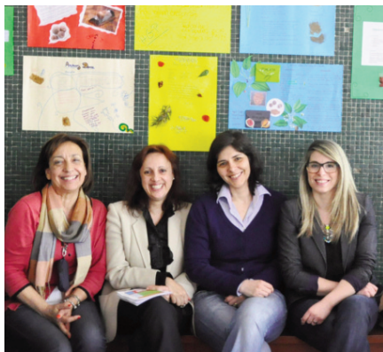
O empenho necessário para o sucesso da festa