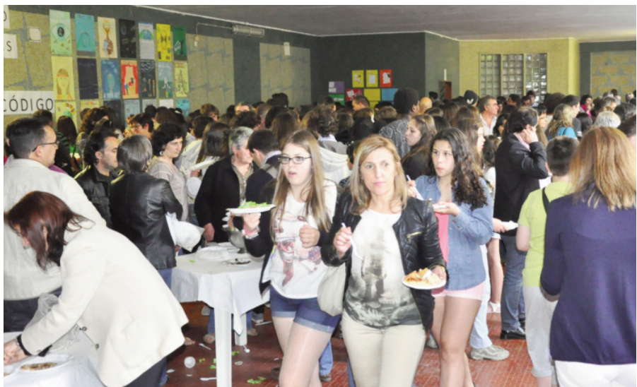
Jantar/Convívio no átrio do 1º Ciclo com a presença de cerca de 700 pessoas, entre alunos, pais e familiares e professores que confraternizaram alegremente