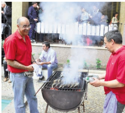
Uma ajuda importante na preparação da ementa