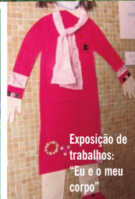
Exposição de trabalhos: "Eu e o meu corpo"