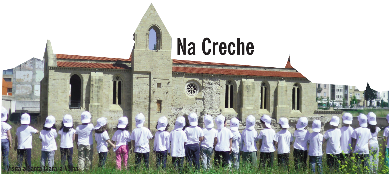
Visita a Santa Clara-a-Velha