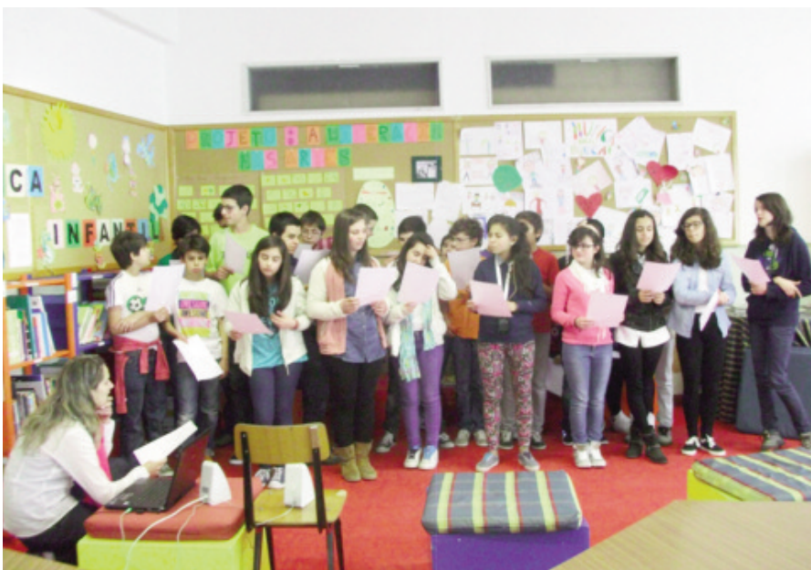
Estágio Curricular de Animação Socioeducativa (ESEC) - Projeto: “A Literacia nas Artes” (27/05/2013)

Por isso, a BE é viva, alegre, movimentada e lugar de encontro, dentro do colégio, e com quem vem de fora, para nos dar a conhecer outras coisas. É desta dinâmica que vive um espaço integrador, no seio da comunidade CST, dos mais diversos níveis de ensino: diariamente e de modo planificado a nossa BE São Teotónio acolhe os mais pequenos e os maiores, num plano de atividades composto por um mosaico de diferenças em que se juntam saberes curriculares e um conjunto de aprendizagens que decorrem da informalidade. Procura-se a BE como local para estudar. É na BE que os mais pequenos assistem a sessões de animação de leitura. Faz-se teatro na BE. É na BE que se recebem convidados que vêm fazer conferências dirigidas aos mais velhos, os do Secundário. Na BE cruzam-se, em diálogo, “velhos” autores e