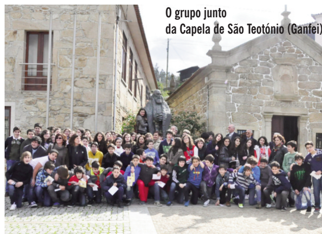
O grupo junto da Capela de São Teotónio (Ganfei)

Um espetáculo, que aliando a arte de repre-