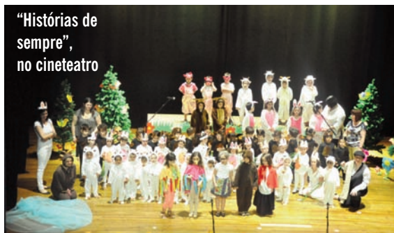
"Histórias de sempre", no cineteatro

nossa eco-escola e num Projeto da Contempo, 1,2,3 Ploc... pinga outra vez .