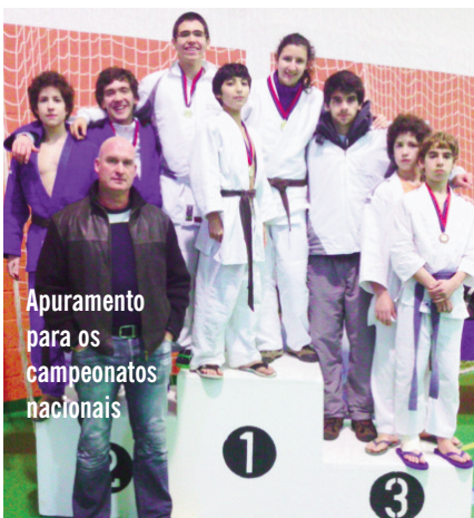
Apuramento para os campeonatos nacionais

Só nesta época já conseguimos ganhar 30 medalhas nestas competições, entre o 1º e o 3º lugar: